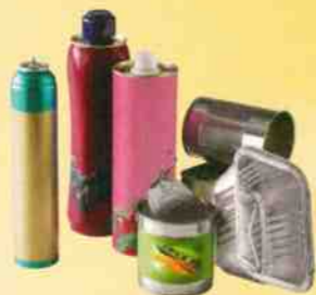
Bidons, canettes, barquettes, boîtes acier et aluminium