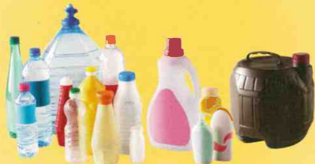
Bidons, bouteilles et flacons plastiques