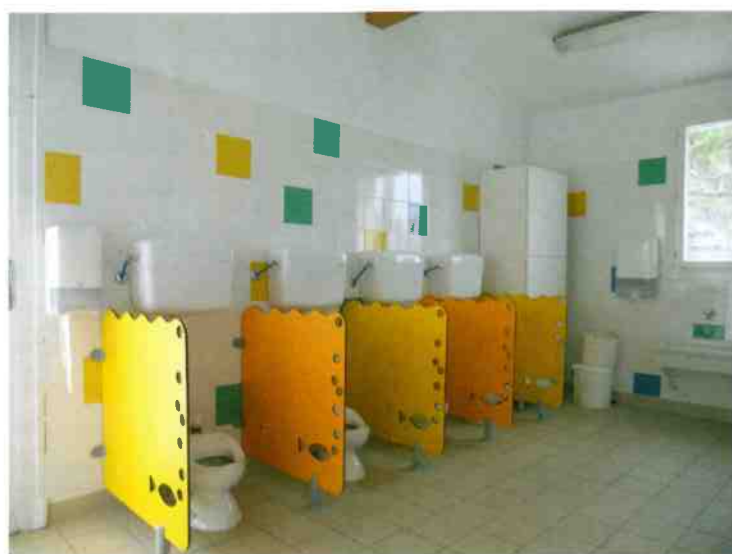
Sanitaires école maternelle