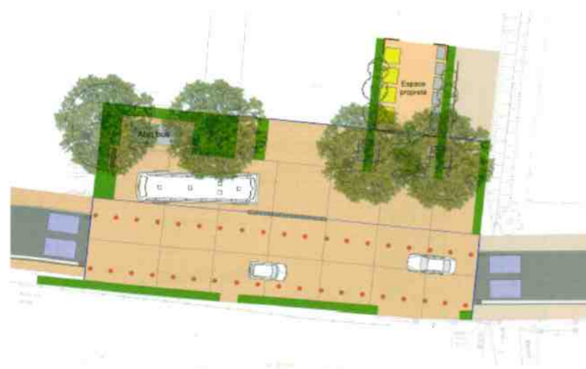
Sécurisation du cheminement piétons (partie Est)

Aménagement de la rue des Coignets et de la route de saint Roman de Malegarde